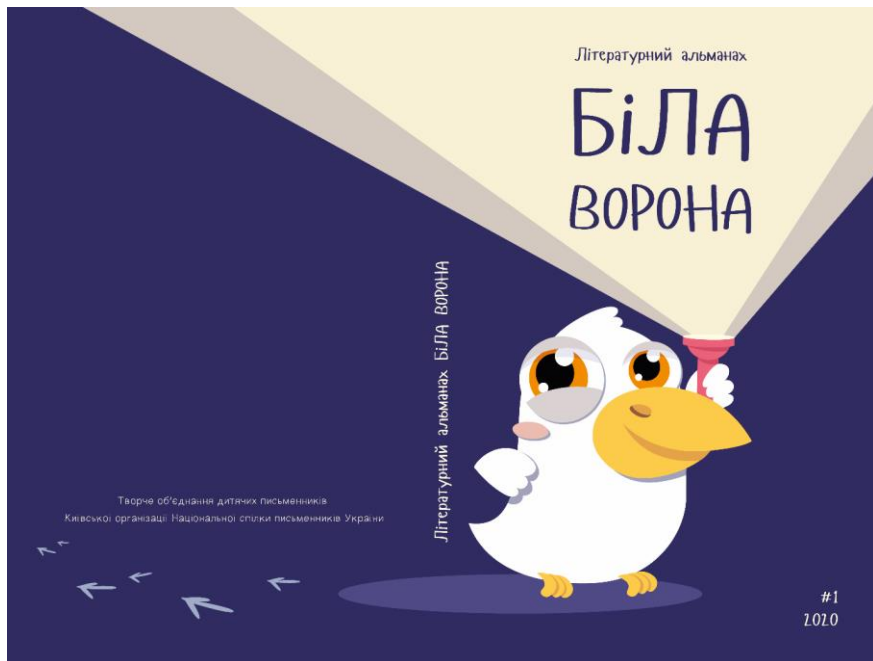
Рисунок 2.3. Варіант оформлення обкладинки видання